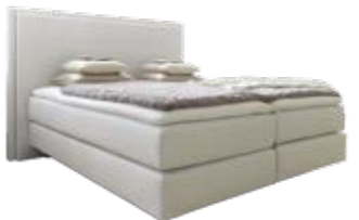
Wandpaneel 0111 mit Passepartout-rahmen mit Stegsteppung Wandpaneel 0107 ohne Passepartout-rahmen mit Stegsteppung