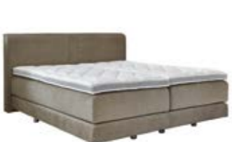
Wandpaneel 0119 mit handwerklich eingearbeitetem Keder