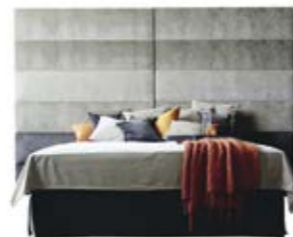
Wandpaneel 0127 , 6 Raster, o. Teilung Wandpaneel 0127 , 6 Raster, mittig geteilt (ab B 330 cm nur mittig geteilt erhältlich)