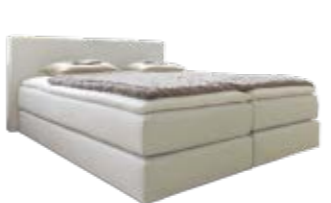
Wandpaneel 0120 , soft gepolstert mit Kederkante, mit schwebender Optik