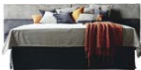
Wandpaneel 0124 , 3 Raster o. Teilung Wandpaneel 0124 , 3 Raster, mittig geteilt (ab B 330 cm nur mittig geteilt erhältlich)