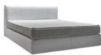
Kopfteil 135 mit gelegter Falte und softer Komfortpolsterung