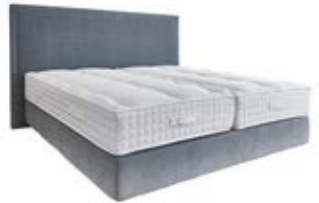
Wandpaneel 0110 mit Passepartout-rahmen ohne Steppung Wandpaneel 0106 ohne Passepartout-rahmen ohne Steppung