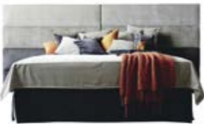
Wandpaneel 0125 , 4 Raster o. Teilung Wandpaneel 0125 , 4 Raster, mittig geteilt (ab B 330 cm nur mittig geteilt erhältlich)