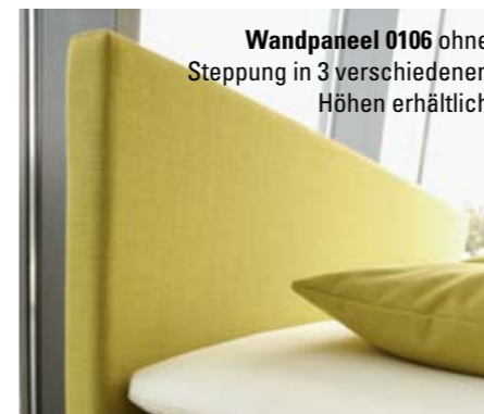
Wandpaneel 0106 ohne Steppung in 3 verschiedenen Höhen erhältlich