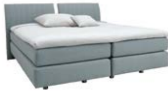
Kopfteil 0132** mittig geteilt mit vertikaler Steppung