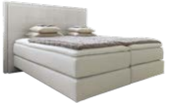
Wandpaneel 0112 mit Passepartout-rahmen mit quadratischer Steppung Wandpaneel 0108 ohne Passepartout-rahmen mit quadratischer Steppung