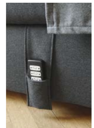
Eine praktische Klett Tasche beherbergt die handliche - optional auch kabellos erhältliche - Fernbedienung