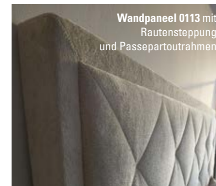
Wandpaneel 0113 mit Rautensteppung und Passepartoutrahmen