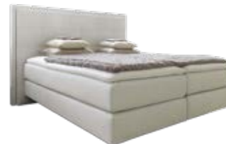
Wandpaneel 0113 mit Passepartout-rahmen mit Rautensteppung Wandpaneel 0109 ohne Passepartout-rahmen mit Rautensteppung