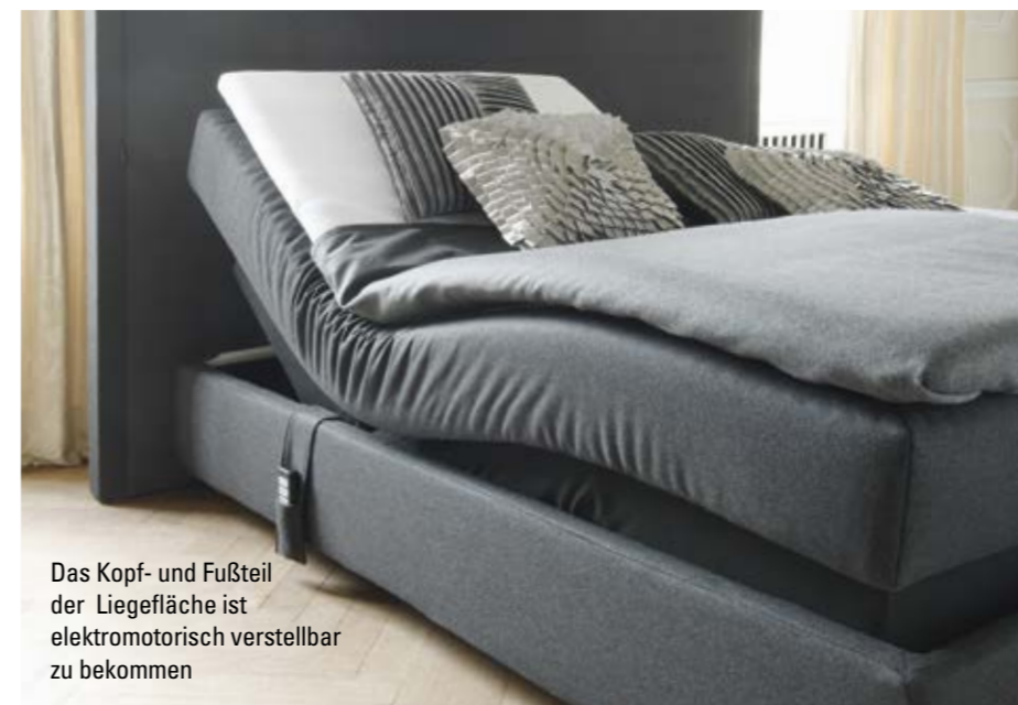
Das Kopf- und Fußteil der Liegefläche ist elektromotorisch verstellbar zu bekommen