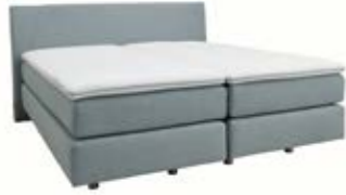
Kopfteil 0128* mit leicht abge-schrägten Kopfteilleisten