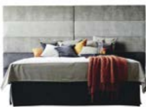
Wandpaneel 0126 , 5 Raster, o. Teilung Wandpaneel 0126 , 5 Raster, mittig geteilt (ab B 330 cm nur mittig geteilt erhältlich)