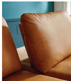
Komfortable Sitztiefenverstellung für ergonomisches Sitzen oder extrem entspanntes „Loungen“.