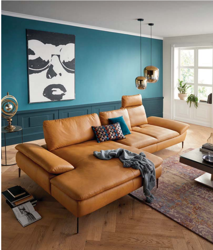
Extragroßer Longchair, für 2 Personen geeignet.

Polsterecke Contur® Montefano , Leder kurkuma, bestehend aus: Longchair groß Armlehne links mit Sitztiefenverstellung, Sofa groß Armlehne rechts mit Sitztiefenverstellung, Metallfuß bronze, Sitzhöhe ca. 47 cm, Sitz aus ergo-PUR-Schaum und hochwertigem Gemisch aus Polyesterfasern und Schaumstoffstäbchen, BHT ca. 339x89x164 cm, Seitenteilverstellung optional.