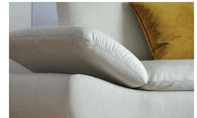
Exklusives Armteil mit Aufstellfunktion in Rastereinteilung - optional.

Polsterecke Contur® Montefano , Leder, bestehend aus: Sofa Armlehne links inkl. Sitztiefenverstellung, Eckelement, Sofa Armlehne rechts inklusive Sitztiefenverstellung, Unterfederung dauerelastische Wellenfedern, Sitzaufbau ergo-Pur Schaum und ein hochwertiges Gemisch aus Polyesterfasern und Schaumstoffstäbchen, Metallfuß schwarz, Sitzhöhe ca. 47 cm, BHT ca. 321x89x321 cm, Seitenteilverstellung optional.