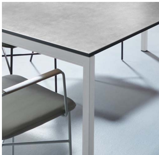
Contur® Pienza – Filigranes Metall Gestell in schwarzgrau, schwarz oder weiß pulverbeschichtet