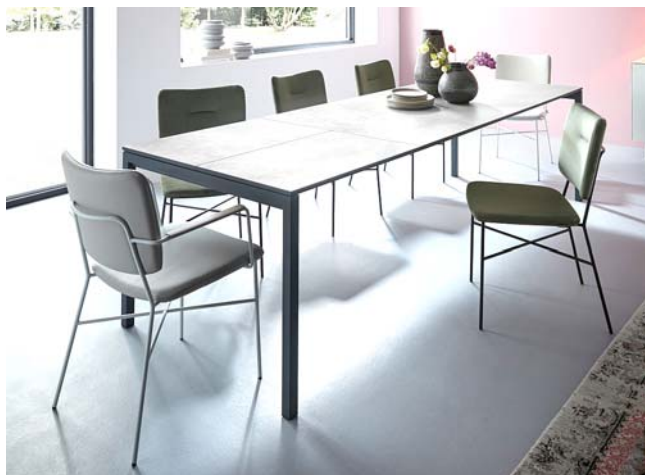
Stühle Contur® Gubio