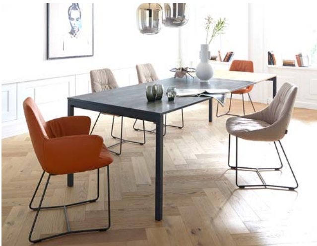
Stühle Contur Pegara