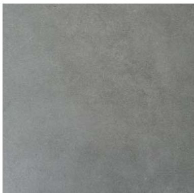
LC 3140 zement steingrau