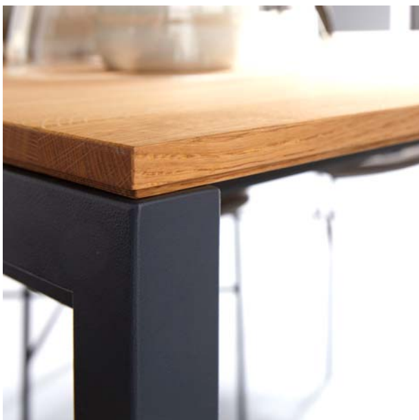
Contur® Pienza –schlichte Tischplattenlinienführung