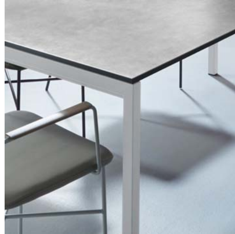
Gestell pulverbeschichtet ohne Aufpreis: RAL 9010 reinweiß lackiert