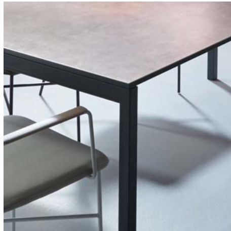
Gestell pulverbeschichtet Standard: RAL 7021 - schwarzgrau