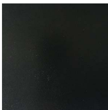
UF 0200 anthrazit