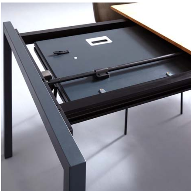
Contur® Pienza – Leicht gängige Auszugsfunktion mit Klappenlage