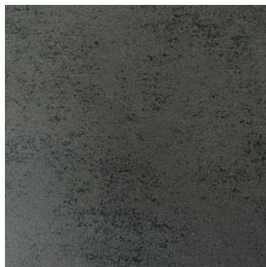
LC 3135 zement montana