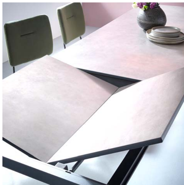
Contur® Pienza – integrierte Klappenlage