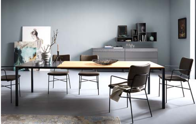
Stühle Contur Gubio