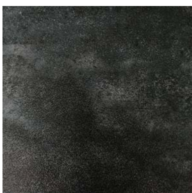
OX 1115 oxide darknight