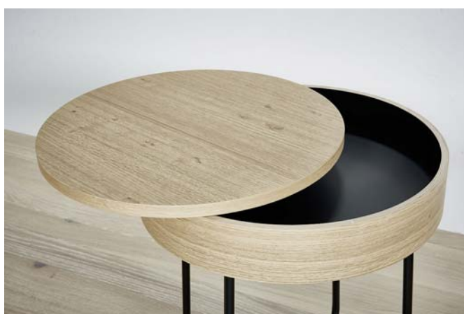
Raum.Freunde Selma –Platte drehbar