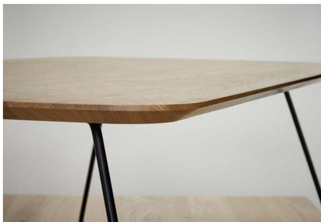
Raum.Freunde Luise – Tischplatte massiv mit Schweizer Kante