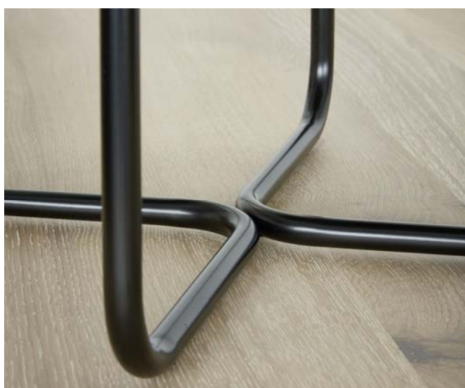
Raum.Freunde Selma – Verarbeitungsdetail