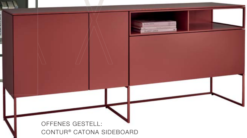
OFFENES GESTELL: CONTUR® CATONA SIDEBOARD Das stylische Sideboard in indisch Rot steht sicher auf einem offenen Metallgestell und überzeugt durch moderne Asymmetrie.