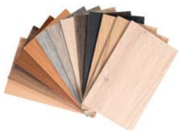
14 ECHTHOLZ- FURNIERE