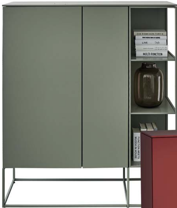
GESCHLOSSENES GESTELL: CONTUR® CATONA HIGHBOARD Das geschlossene, salbeifarbene Metallgestell trägt den gleichfarbigen Korpus und bildet einen raffinierten Rahmen für die offenen Fächer.