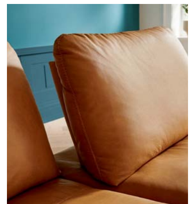
Komfortable Sitztiefenverstellung für ergonomisches Sitzen oder extrem entspanntes „Loungen“.