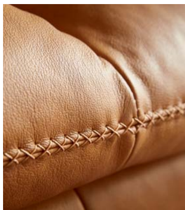
Handwerkliche wertvolle Kreuznaht mit hohem Designanspruch.

Polsterecke Contur® Montefano , Leder kurkuma, bestehend aus: Longchair groß Armlehne links mit Sitztiefenverstellung, Sofa groß Armlehne rechts mit Sitztiefenverstellung, Metallfuß bronze, Sitzhöhe ca. 47 cm, Sitz aus ergo-PUR-Schaum und hochwertigem Gemisch aus Polyesterfasern und Schaumstoffstäbchen, BHT ca. 339x89x164 cm, Seitenteilverstellung optional.