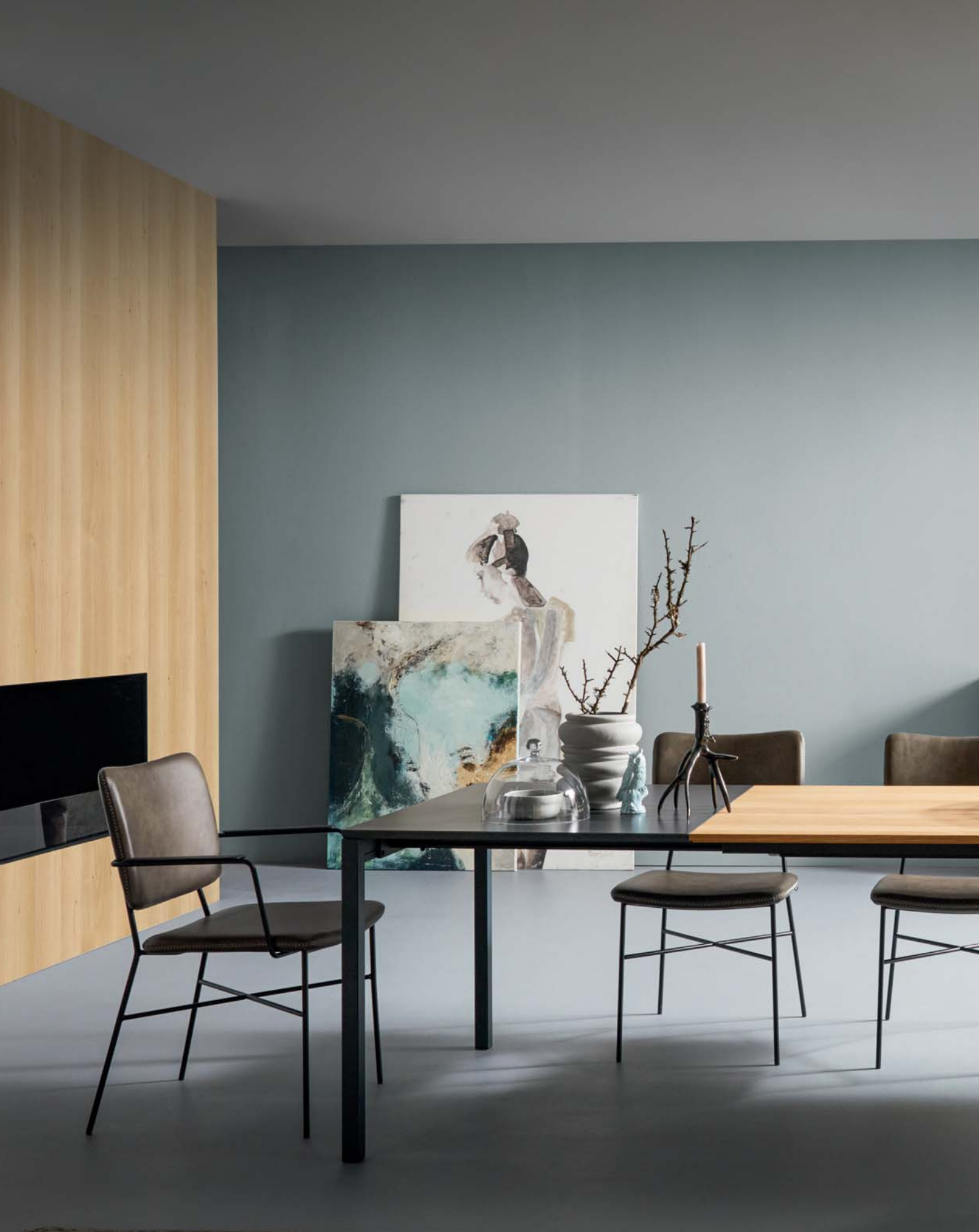
Tisch Contur® Pienza , Platte astige Eiche massiv, Pigmentfüllung braun, 4-Fuß anthrazit pulverbeschichtet, BHT ca. 200x76x100 cm, inkl. Klappeinlage Keramik UF 0200 anthrazit 80 cm, ausziehbar auf ca. 280x100 cm.