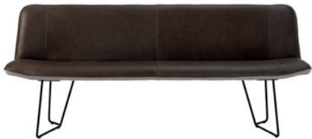
Untergestell mit Kufe